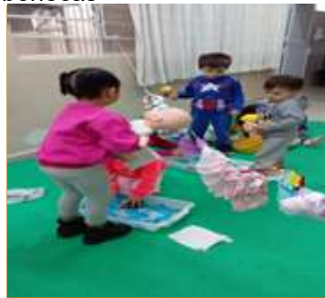
Atividade 6: Simulando banho em bonecas