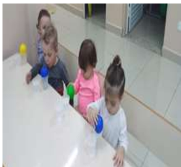
Atividade 5: Varal com bexigas coloridas