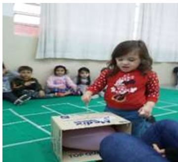
Atividade 6: Resgatar a bolinha