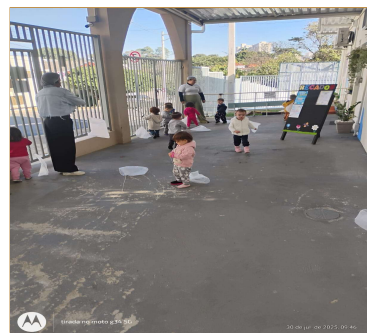
Atividade 5: Brincar