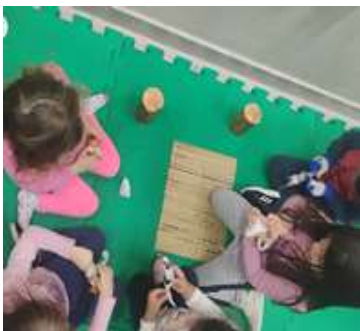
Atividade 5: Cabana da leitura