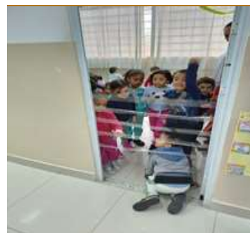
Atividade 7: Circuito com obstáculos