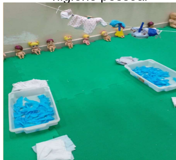
Atividade 2: Cuidado com bebê, estimulando higiene pessoal