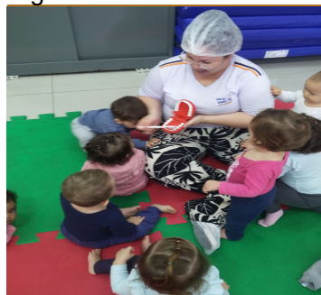
Atividade 7: Incentivando uma boa higiene bucal