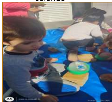
Atividade 6: Brincadeira do retalho colorido