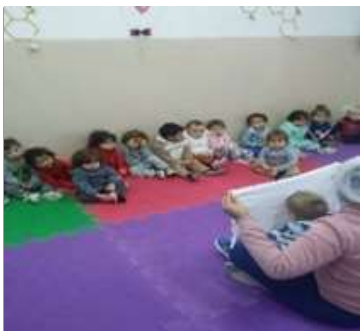
Atividade 5: : Cadê? Achou!