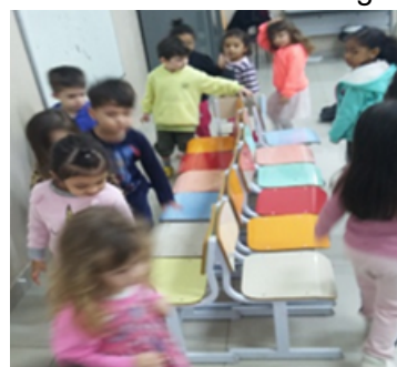
Atividade 7: Explorando possibilidades com cones e argolas