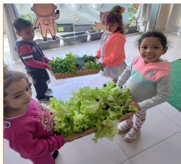
Atividade 2: Projeto horta: Colheita