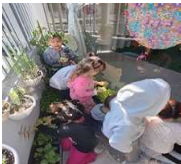
Atividade 1: Projeto horta: Cuidado com a horta