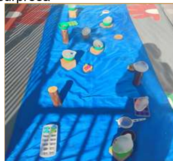
Atividade 3: Espaço organizado, gelo surpresa