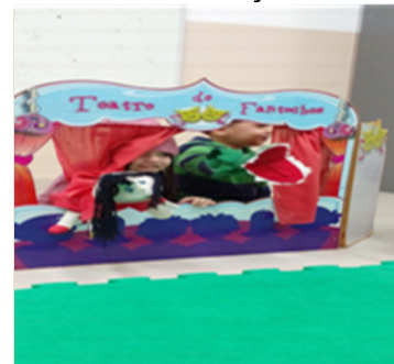
Atividade 7: Teatro com participação das crianças