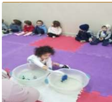
Atividade 2: Pescaria com peneira