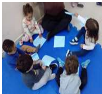
Atividade 6: Dobradura