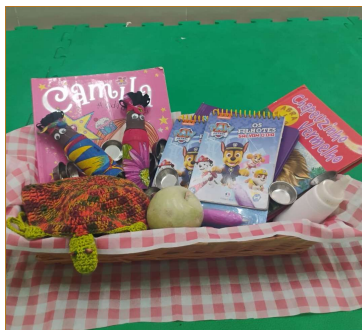
Atividade 1: Cesto literário