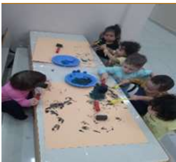
Atividade 1: Pintura livre com rolinhos