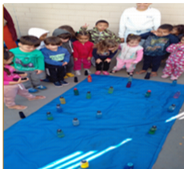
Atividade 5: Garrafas surpresa