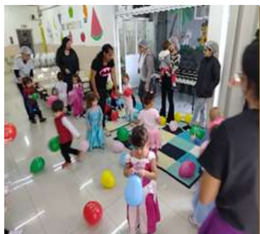
Atividade 4: Expressar