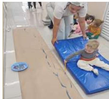
Atividade 3: Pintura em movimento